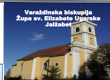
Varaždinska biskupija Župa sv. Elizabete Ugarske Jalžabet

Pri analiziranju utjecaja nekog projekta na okoliš obično se promatraju njegove posljedice za tlo, vodu i zrak, ali nije uvijek uključena detaljna studija o njegovu utjecaju na bioraznolikost, kao da bi gubitak nekih životinjskih i biljnih vrsta ili skupina bio nešto malo važno. Ceste, novi nasadi, postavljanje ograda na nekim područjima, brane na vodi i slični zahvati istiskuju prirodna staništa, i katkad ih dijele na takav način da se životinjske populacije ne mogu slobodno kretati i lutati, što ima za posljedicu da nekim vrstama prijete opasnost od izumiranja. Postoje alternative koje, ako ništa drugo, barem ublažavaju utjecaj tih projekata, primjerice stvaranje bioloških koridora, ali tu brigu i pozornost pokazuje tek nekolicina zemalja. Kada se neke vrste koriste u komercijalne svrhe, vrlo mala pozornost posvećuje se njihovoj reprodukciji kako bi se izbjeglo pretjerano opadanje njihova broja i posljedično narušavanje ravnoteže ekosustava. (Laudato Si - Hvaljen Budi - br. 35)